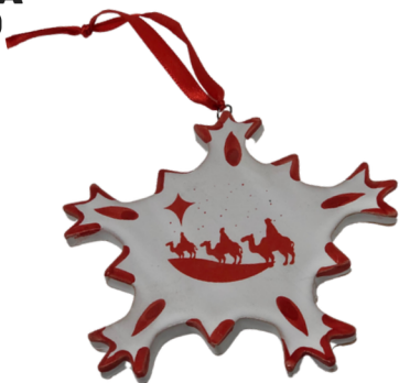
CRISTALLO DI NEVE APPENDINO