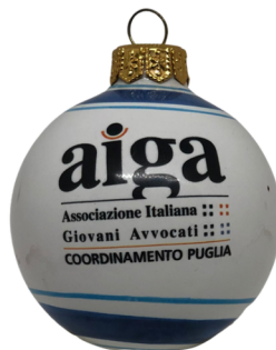
PALLINA DI NATALE