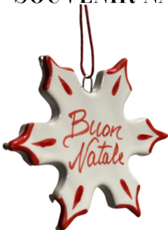
FIOCO DI NEVE APPENDINO